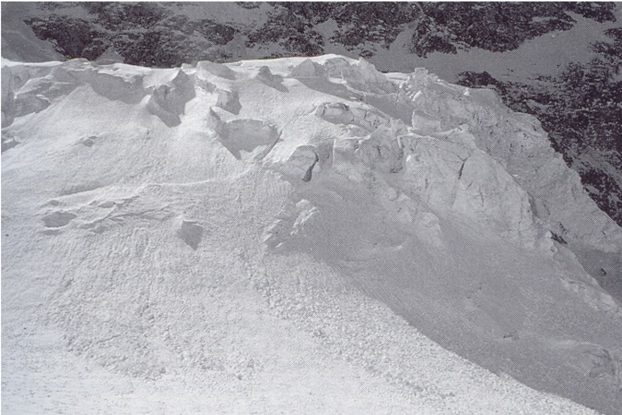
Un comune rischio mentre si pratica alpinismo in Islanda. Valanga di ghiaccio e neve (Mt. Eyafjallajökull).

Sugli altipiani islandesi non vi sono ponti per il superamento dei fiumi o, nel migliore dei casi, vi è qualche ponticello magari distante dal sentiero. Guadare fiumi e rapide è quindi cosa all'ordine del giorno per gli escursionisti in montagna. L'impiego di corde o di pietre sulle quali posizionare i piedi, passare il guado in piccoli gruppi, guadare rivoli più piccoli piuttosto che il bacino più grande, attraversare ponti di neve ed evitare i fiumi camminando sulle lingue dei ghiacciai sono soluzioni pratiche che bisogna tenere a mente. Guadare in automobile (con veicolo 4x4) richiede abilità ed esperienza; non guadare mai con un veicolo un fiume che non sia guadabile a piedi!