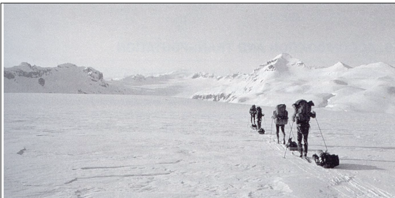
Alpinisti in un attraversamento in rotta verso il massiccio Esjufjöll (calotta del Vatnajökull )

Gli sciatori di fondo e quelli di montagna (sia per un week-end o sia fino ad una vacanza di più giorni) si spingono anche sulle aree degli altipiani o attraversano le calotte di ghiaccio.