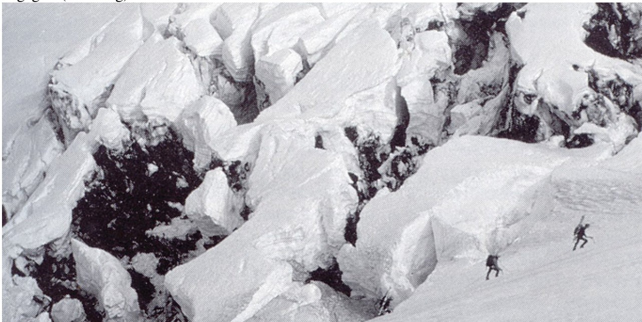
Sci alpinisti in ascesa sul ghiacciaio Eyjafjallajökull.

Se ci si sposta con gli sci, è consigliabile utilizzare le slitte (pulkas) per il trasporto del proprio bagaglio (30-80 kg).