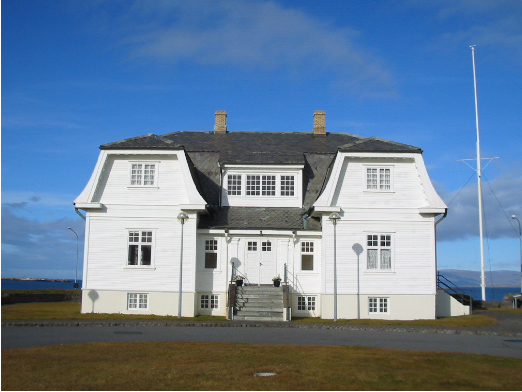
L'EDIFICIO DOVE AVVENNE IL SUMMIT NEL 1986.